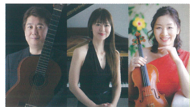
TOMONAS Special (トモナス スペシャル)

2017年 第12回日本構造デザイン賞 松井源吾特別賞 2017年 第39回石膏ボード賞 特別功労賞 その他多数の受賞歴を持つ。構造の視点から様々な材料の可能性を追求中。天童市の常安寺五重塔も監修。